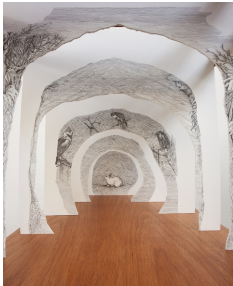
Nazareno, 1 e 2 (detalhe) Como eu fiz para entender o teatro , 2010. Madeira, nanquim s/ papel. 170 cm x 60 cm x 70 cm