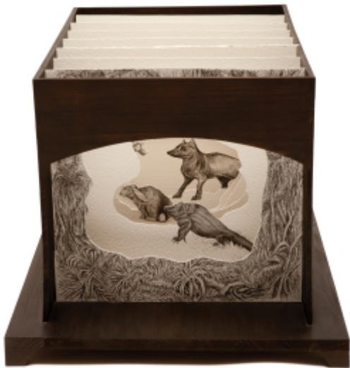
Nazareno 3 e 4 (detalhe) Sem fim, 2012 Madeira, nanquim s/ papel. 39 cm x 46 cm x 62 cm